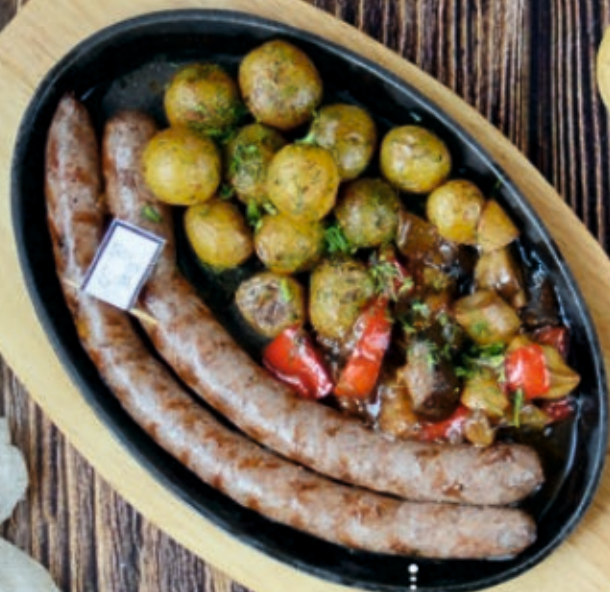
Франкфуртские с картофелем