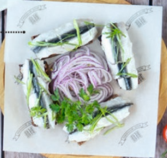
Килька на ржаных тостах 180/30 г 230 р.