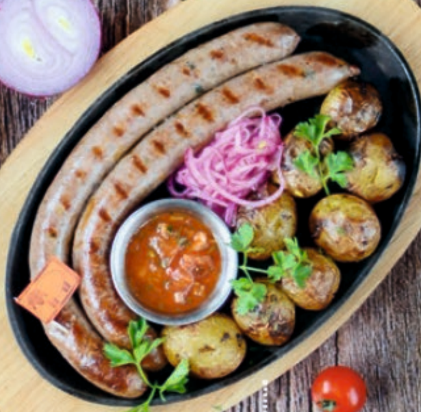
Бамбергские с картофелем на мангале