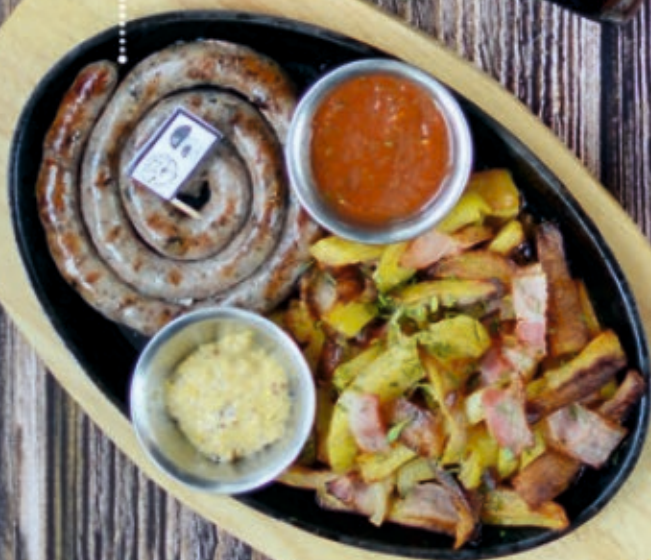
Домашние охотничьи с крокетами