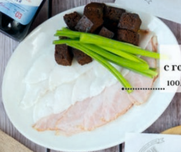
Сало с горчичными гренками 100/80 г 220 р.