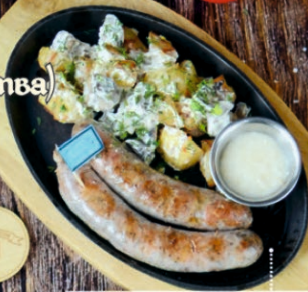
Мюнхенские с грибами и картофелем