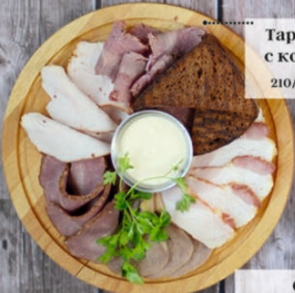
Тарелка мясная с копченостями 210/50/30 г 580 р.