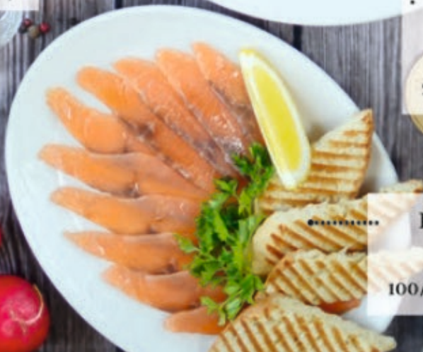
Балыки семги 100/50 г 470 р.