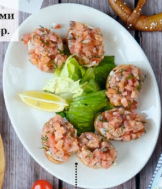
Брускетта с балыком семги 250 г 420 р.