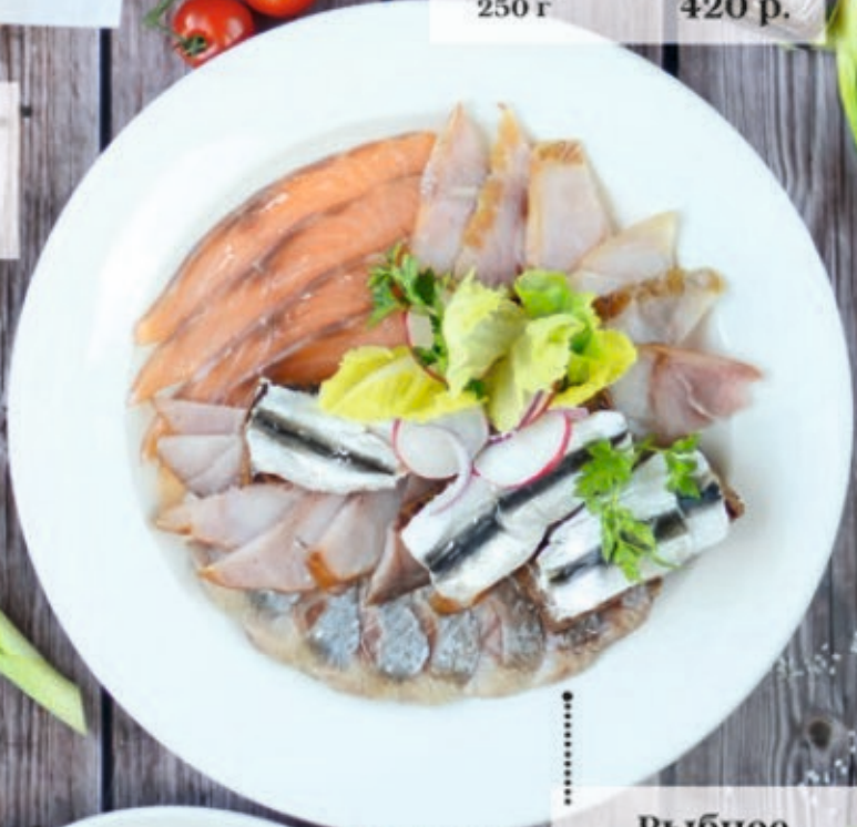
Рыбное ассорти 270/80 г 790 р.