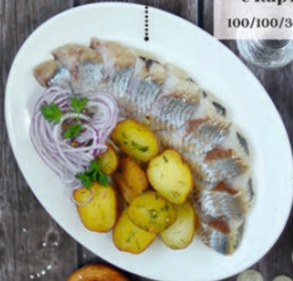
Сельдь с картофелем 100/100/30 г 240 р.